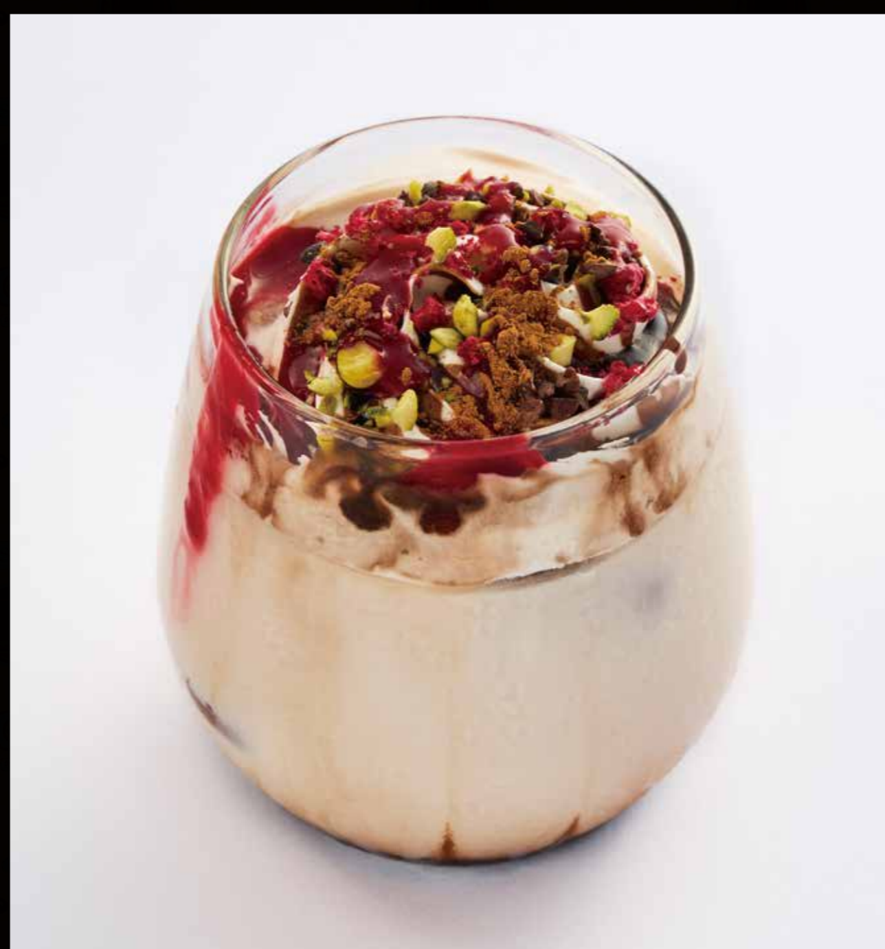
『イクサラン』の ショコラドリンク