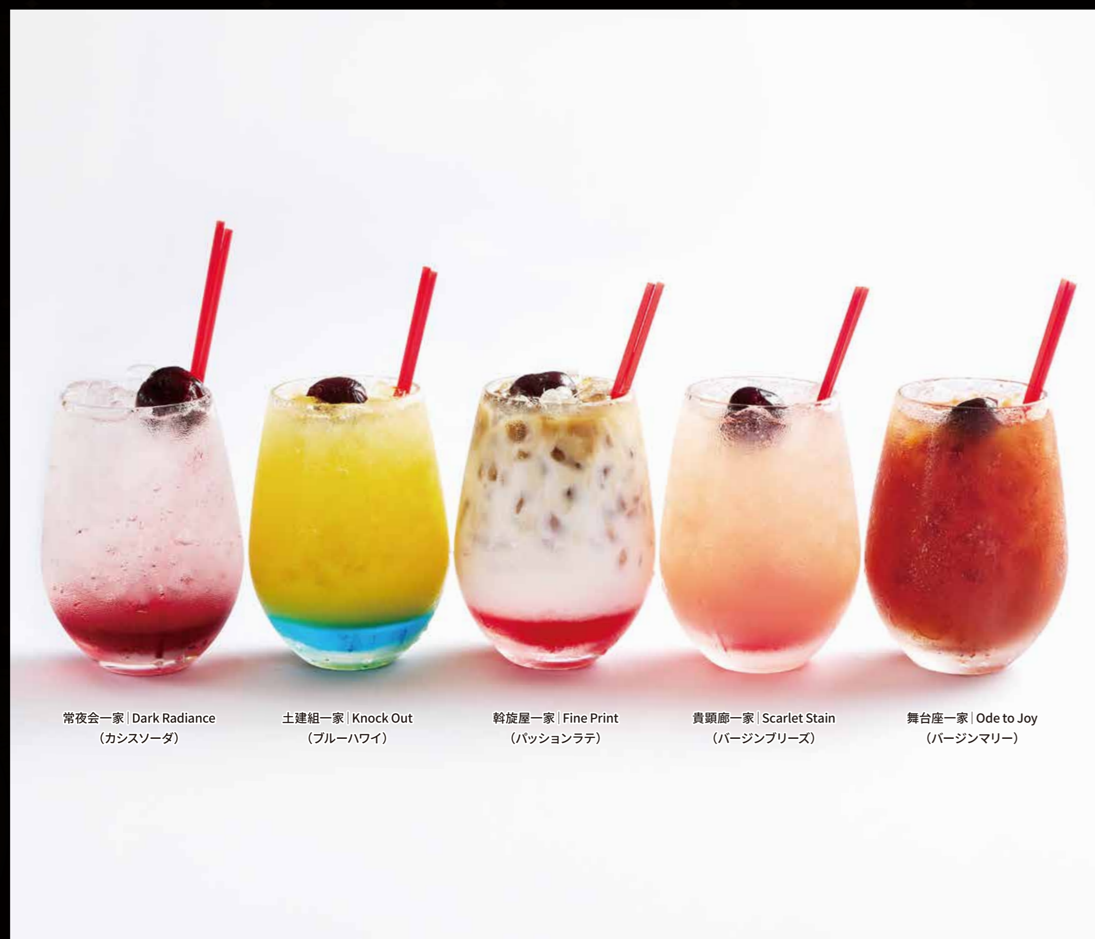
常夜会一家 | Dark Rance (カンスゾウダ) | 土曜組一家 | Knock Out (ブルーハワイ) | 鈴鹿組一家 | Fine Print (ハッシュコラ) | 貴顕邸一家 | Scarlet Stain (バーシンプリーズ) | 舞台座一家 | Ode to Joy (バーシンプリー)