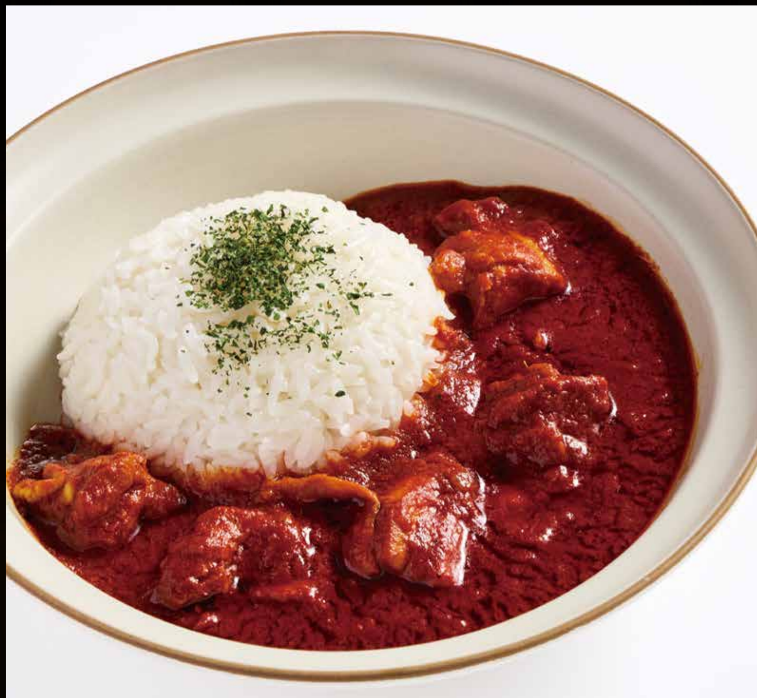
ラヴニカ風 バターチキンカレー