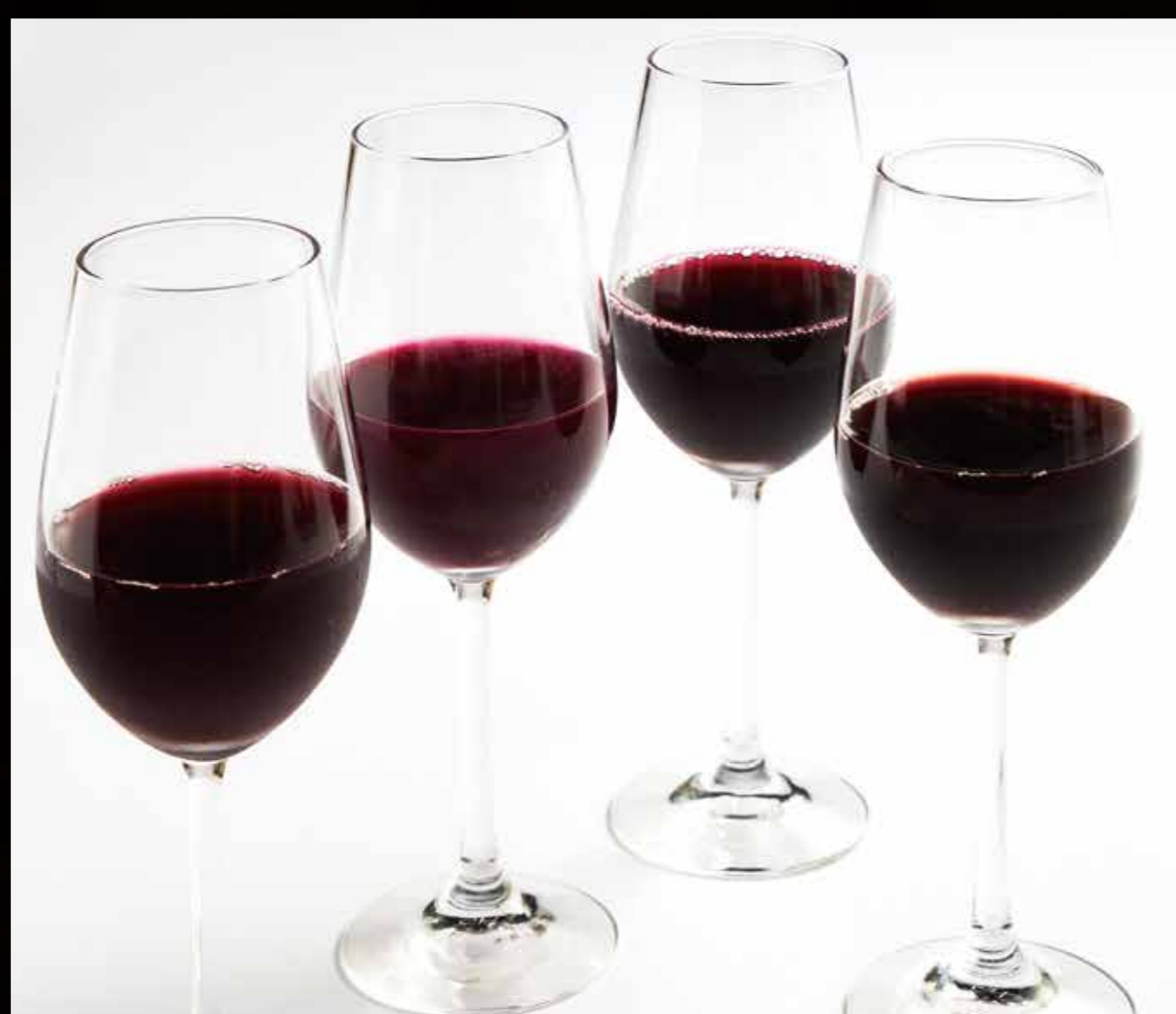
人気の吸血鬼が活躍する舞台『インストラッド』にフィーチャーした “インストラッドブラッドワイン風ぶどうジュース”