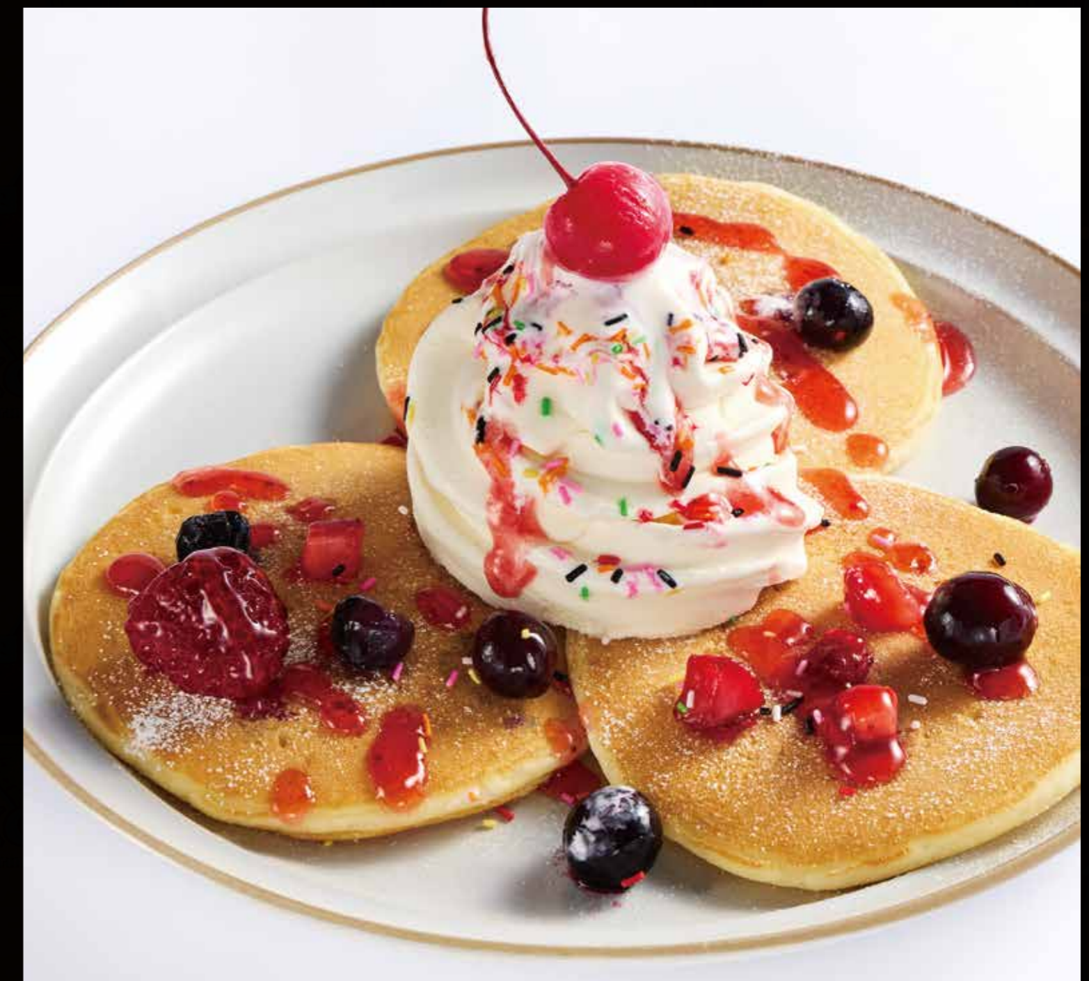
食物トークンの食物 “ベリーマジックパンケーキ”

2023年9月発売『エルドレインの森』で活躍するキャラクター、ジンジャーブルートの表情がかわいい5色のドリンク。ソフトクリームとクッキーを添えて仕上げました。