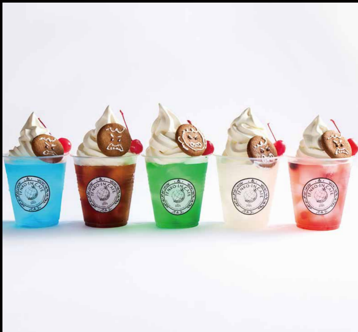
ジンジャーブルート “サマーフロートフィズ”

『ラヴニカのギルド』『ラヴニカの献身』のストーリーに登場した、ブレインズウォーカー「ラル・ザレック」が食べていたカレーを再現。「ラルが頼んだカレーは真っ赤で、肉の塊が氷山のように浮いていた。」