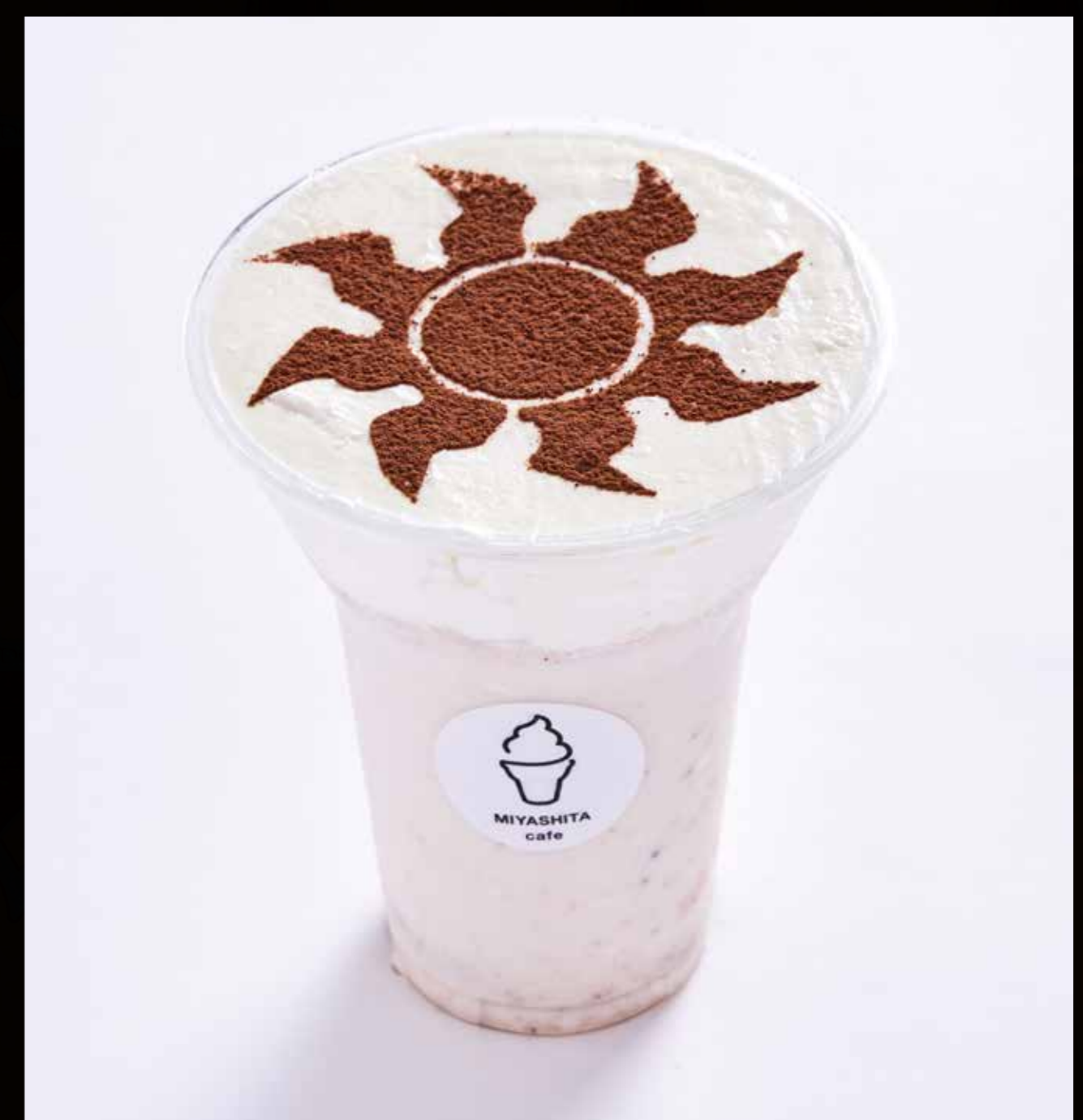
《天界の曙光》 ソフペチーノ