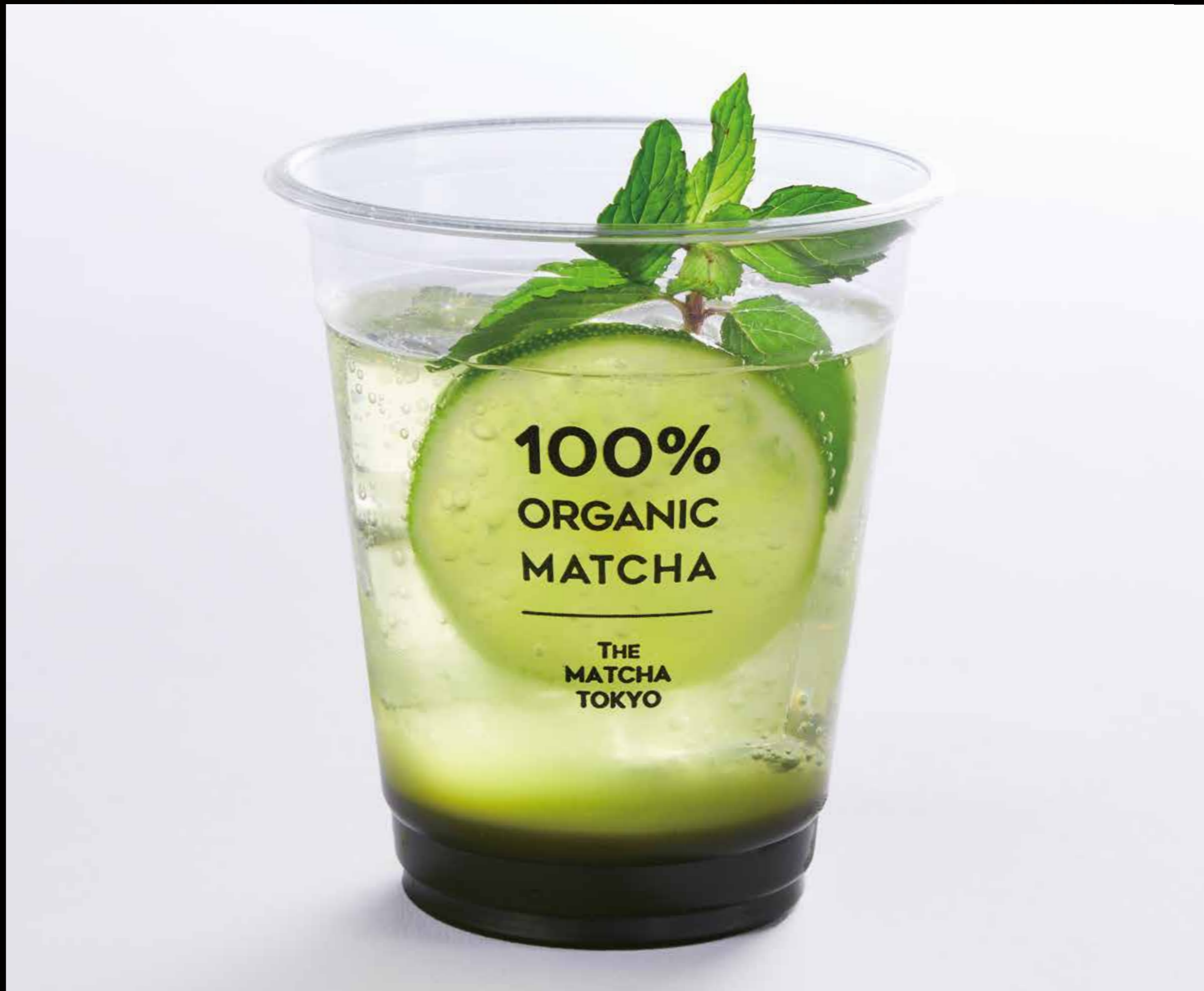
《活力回復》 抹茶モヒート