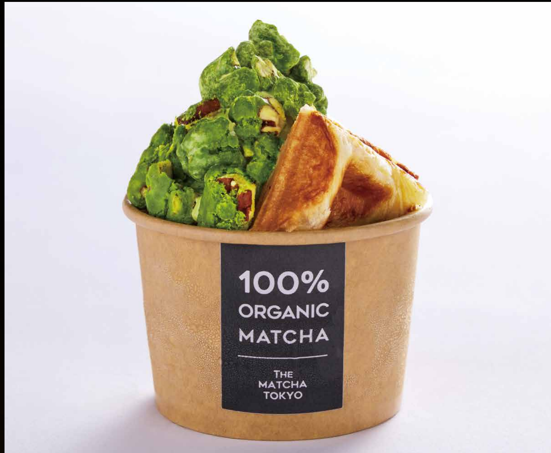
《大量の芽吹き》 抹茶ソフトマウンテン